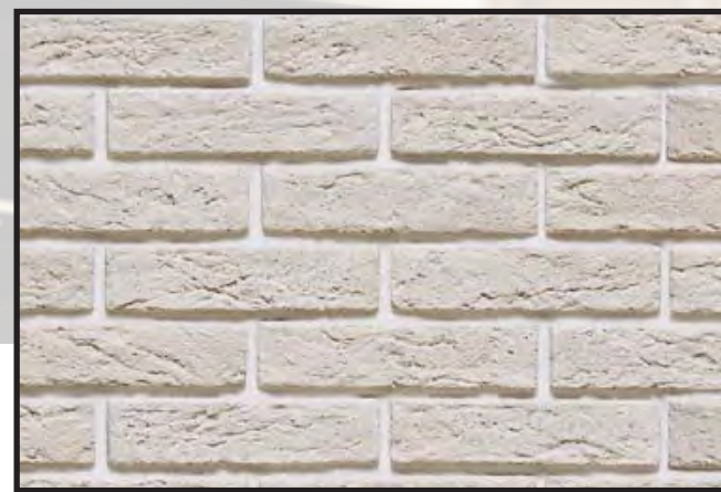
Искусственный камень КАМЕЛОТ БРУКЛИН

http://www.kamelot.ru/products/decorbrick/bruklin